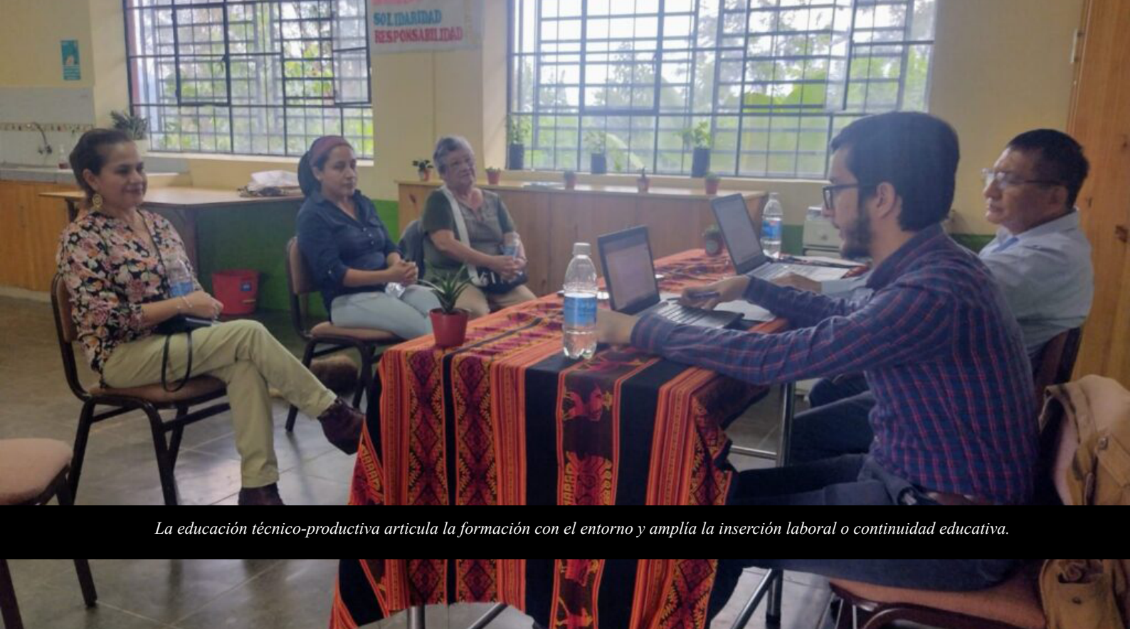
La educación técnico-productiva articula la formación con el entorno y amplía la inserción laboral o continuidad educativa.

La transición de la educación al trabajo es uno de los momentos más decisivos en la vida de las y los jóvenes. En las zonas rurales de América Latina, este tránsito suele darse en condiciones atravesadas por la vulnerabilidad socioeconómica, la limitada oferta educativa en el territorio y la informalidad del mercado laboral local. En ese escenario, la educación técnico-productiva aparece como una alternativa que busca articular la formación con las dinámicas productivas del entorno y ampliar las posibilidades de inserción laboral o continuidad educativa de quienes egresan. Sin embargo, sigue abierta la pregunta por su capacidad real para transformar las trayectorias de la juventud rural, más aún en el caso peruano, donde la evidencia empírica sobre este punto todavía es reducida. En ese marco, resulta especialmente relevante el estudio reciente de investigadores del IIPE-UARM, que examina las trayectorias educativas y laborales de jóvenes egresados de un programa de articulación entre formación técnico-productiva y escuelas secundarias rurales en la provincia de Huancabamba, Piura ( Egúsquiza Loayza et al., 2026 ).