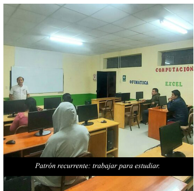
Patrón recurrente: trabajar para estudiar.

El estudio también da cuenta de la pertinencia de las competencias técnicas en relación con la economía local, aunque con ciertos matices. En el módulo agropecuario, por ejemplo, algunos docentes señalan que la formación tiende a reproducir saberes que los jóvenes ya traen de sus hogares, lo que abre una pregunta por la pertinencia y el valor agregado real del currículo. En contraste, las habilidades socioemocionales (como la empatía, el trabajo en equipo, la comunicación asertiva y la resiliencia) aparecen como una suerte de infraestructura invisible de las trayectorias: potencian la formación técnica, fortalecen capacidades de negociación y liderazgo, y sostienen los recorridos de las y los egresados en contextos de alta vulnerabilidad.