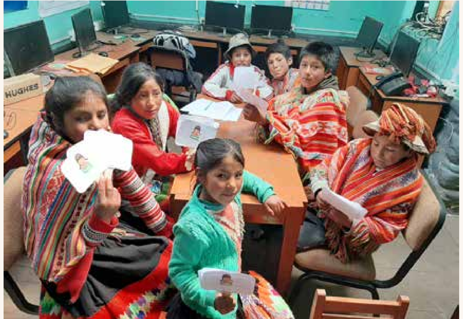
Niños y niñas que participaron del grupo focal. Qillqanqa, UGEL Urubamba, Cusco.