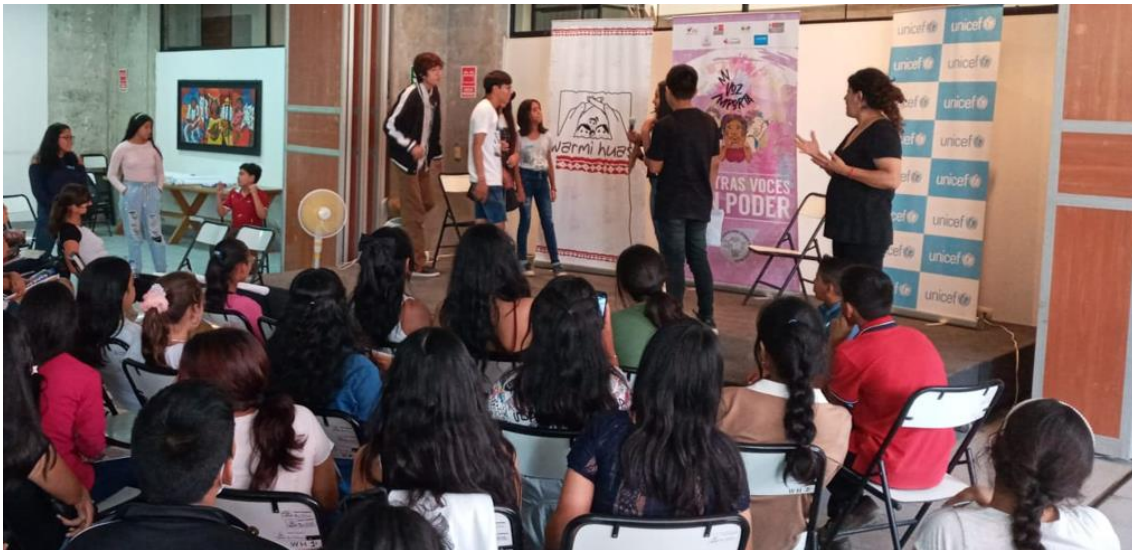
Grupo de adolescentes presentando sus experiencias de opresión mediante la técnica de Teatro-Foro (2023)

“La conciencia crítica da una comprensión cada vez mayor del entorno. Los adolescentes empoderados exploran sus identidades en evolución y emergentes, profundizando su comprensión de cómo negociar entre su papel esperado en el mundo y el papel que quieren desempeñar y jugar para ejercer plenamente sus derechos. La conciencia que los y las adolescentes pueden desarrollar no es sólo sobre uno mismo, sino también sobre las desigualdades y discriminaciones más amplias, que se manifiestan en sus comunidades.” (UNICEF)