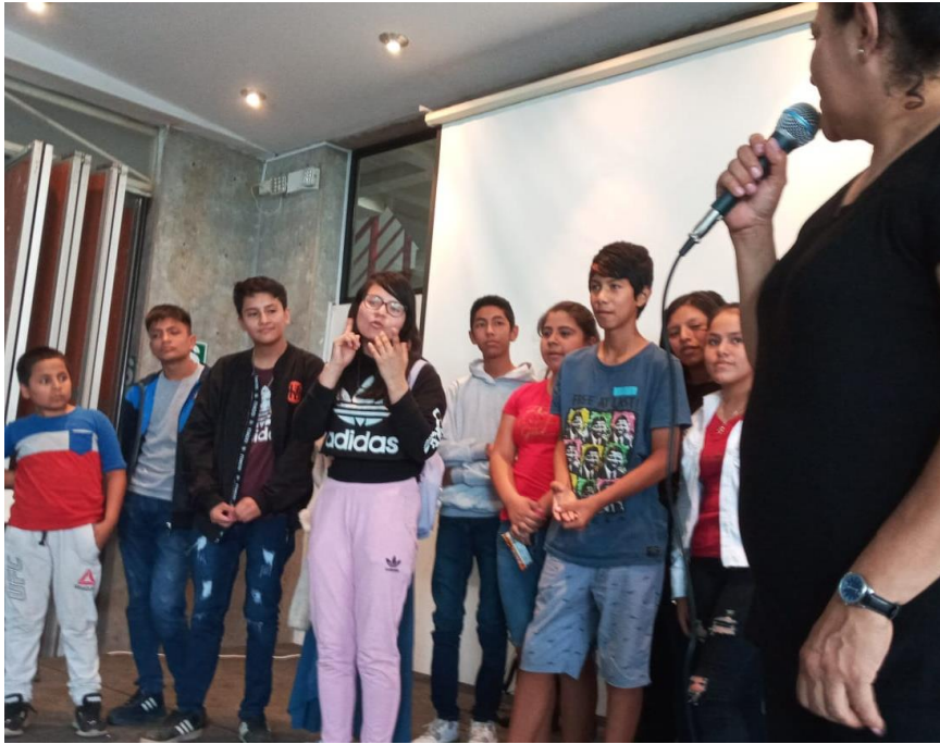
Grupo de adolescentes y niños/as con discapacidad auditiva presentando su iniciativa ciudadana "Mis señas importan", diseñada durante la segunda edición del programa Hatariy (2023)