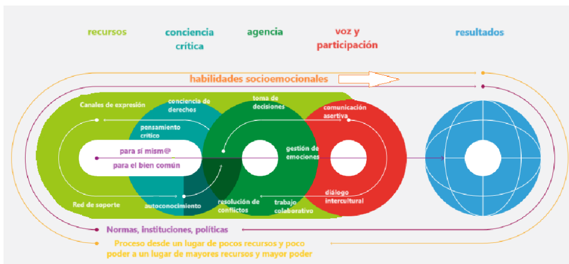
Gráfico 2: Empoderamiento Adolescente (adaptado de UNICEF)

Como muestra el Gráfico 2, el/la adolescente se empodera para sí mismo/a y para el bien común mediante el desarrollo continuo de 4 componentes claves que se traslapan y complementan entre sí: los recursos (o assets, en inglés), la conciencia crítica, la agencia y la voz/participación. Este proceso, en el cual el/la adolescente va transitando de un lugar de pocos recursos y poco poder a un lugar de mayores recursos y mayor poder, se da dentro de un contexto sociocultural, institucional y político que puede o no contribuir al empoderamiento.