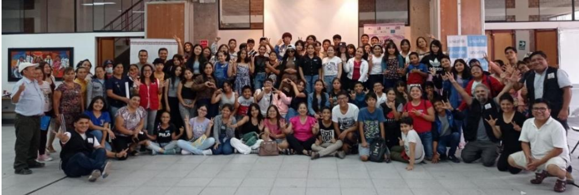
Foto de cierre de Hatariy 2023

Luego de dos años de experiencia, HATARIY se encuentra en etapa de transferencia a las UGEL y DEMUNAs de Lima Norte mediante Programas de Formación de Formadores y asesoría en la planificación institucional para promover la participación adolescente. Adicionalmente, Hatariy ha sido reconocido por el MIMP como una buena práctica y viene siendo utilizado como referente para el diseño del programa de fortalecimiento de capacidades de miembros del CCONNA a nivel nacional.